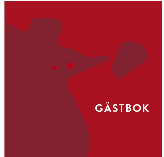
Skiss på omslaget